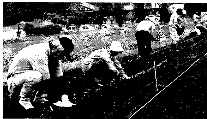
「可能性を秘めた」苗を植栽する＝茅科中央高原で

茅科中央高原は、平千代一市長も「食害対策、健康長寿の面だけなく縄文プロジェクトの切り口にもなるはず」と期待を寄せる。栽培地は茅科中央高原10町、柏原地籍5町でいずれも民有地。地権者の協力を得て遊休農地を借り受け、10坪ほどに育てた苗合わせ4500株を、関係者約15人で植栽した。根が張るまでは水やり、その後は草取りを行う一方、センサーカメラや目視で二ホンジカの食害についても調査する。